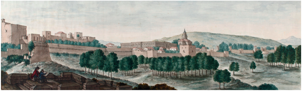
José De Hermosilla y Sandoval (auteur), Juan Moreno (graveur), Vue de l'Alhambra (Première édition de la première partie), 1787