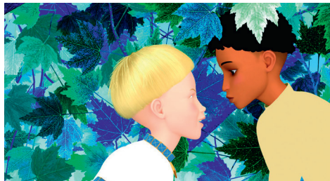
Azur et Asmar

À 18h / Tout public à partir de 6 ans / 1h40 / De 5 à 10€