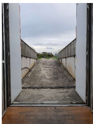
Quai accès décors