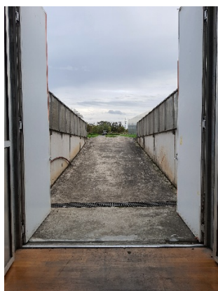
Quai accès décors