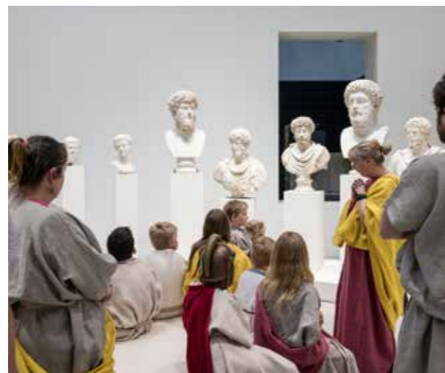
Exposition temporaire « ROME. La cité et l'empire » en 2022

Dans un espace spectaculaire de 1 800 m 2 , le Louvre-Lens organise chaque année deux grandes expositions d'envergure internationale, qui mettent en perspective une époque, un artiste, une civilisation ou encore des thèmes transversaux de l'histoire de l'art. À chaque nouvelle exposition, la Galerie est intégralement repensée autour d'une scénographie créative et immersive. Vivez à chaque exposition une expérience renouvelée.