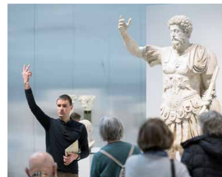
Visite dans la Galerie du temps

Le droit de parole dans les espaces muséographiques est accordé aux seuls détenteurs de la carte professionnelle de guide-conférencier (et sur présentation de celle-ci) ou sur autorisation exceptionnelle de la direction du musée.