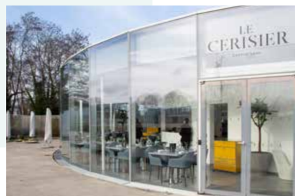
Restaurant L'Atelier du Cerisier

Réservation conseillée au 03 74 49 62 62