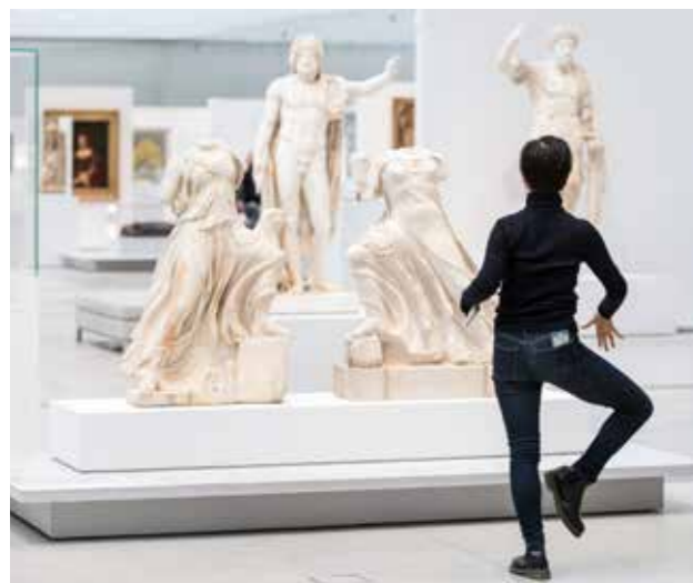
La Galerie du temps © SANAA - IMREY CULBERT - Muséographie : Studio Adrien Gardère