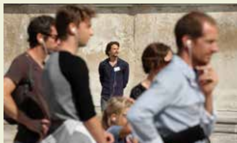
La Vaste Entreprise - Visite de Groupe