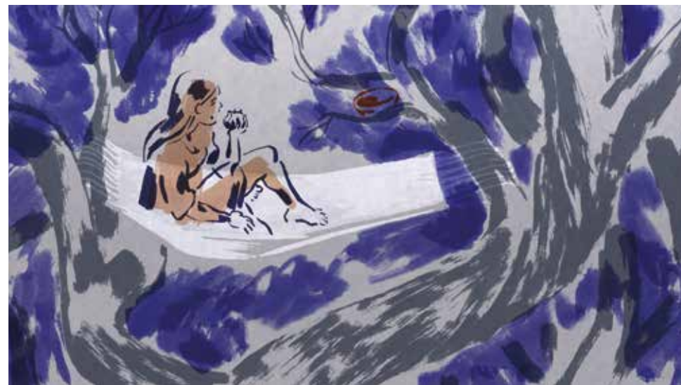
La jeune fille sans main © Sébastien Laudenbach