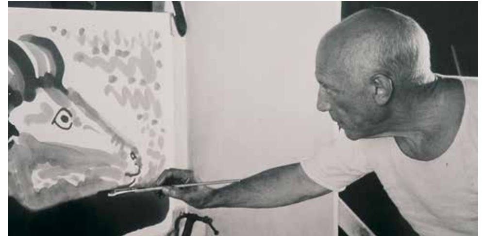
Le Mystère Picasso © Collection Gaumont © Succession Picasso 2021