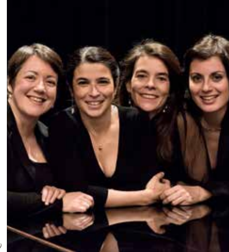
Quatuor Face à Face