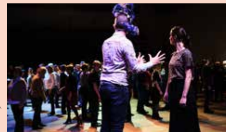
Bal 2019

Chaque année, le 4 décembre marque le lancement des Fêtes de la Sainte Barbe, patronne des mineurs et symbole du territoire. Depuis 2012, cette date, qui n'a pas été choisie au hasard, est aussi celle de l'anniversaire du Louvre-Lens, 9 ans cette année. Pour célébrer ensemble cet événement et en lien avec les Fêtes de la Sainte-Barbe, le Louvre-Lens vous accueille le dimanche 5 décembre pour un grand bal populaire, gratuit et ouvert à tous !