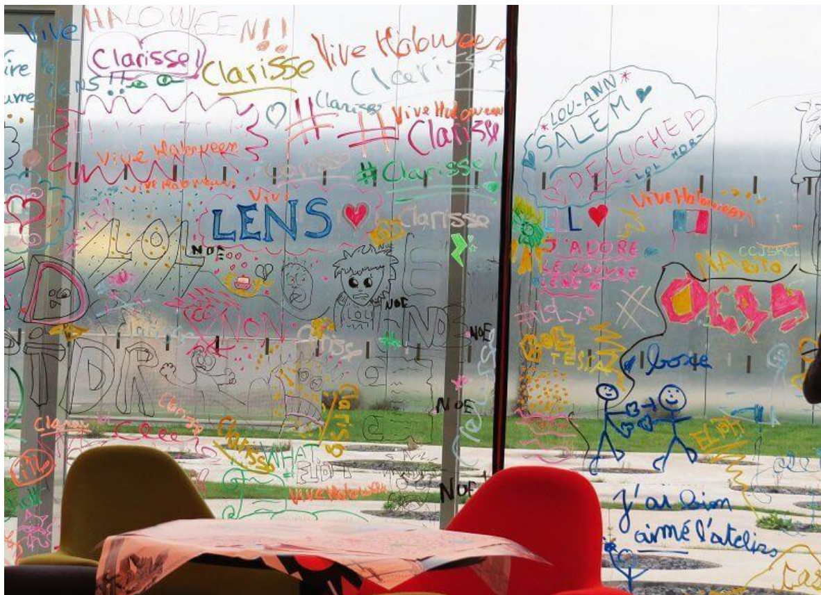
Le mur d'amour vous attend !