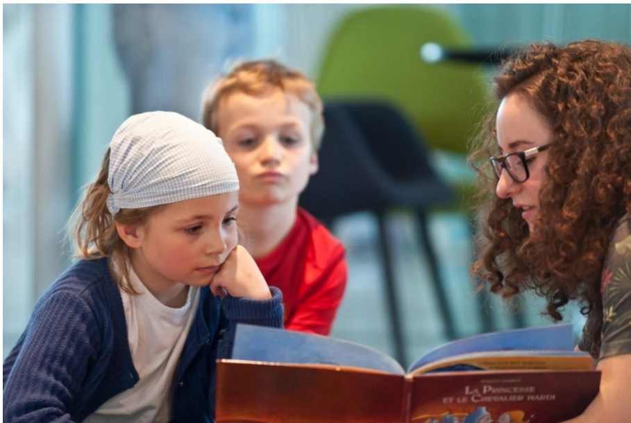
Après l'histoire, ce sera au tour des enfants de se transformer en archéologue