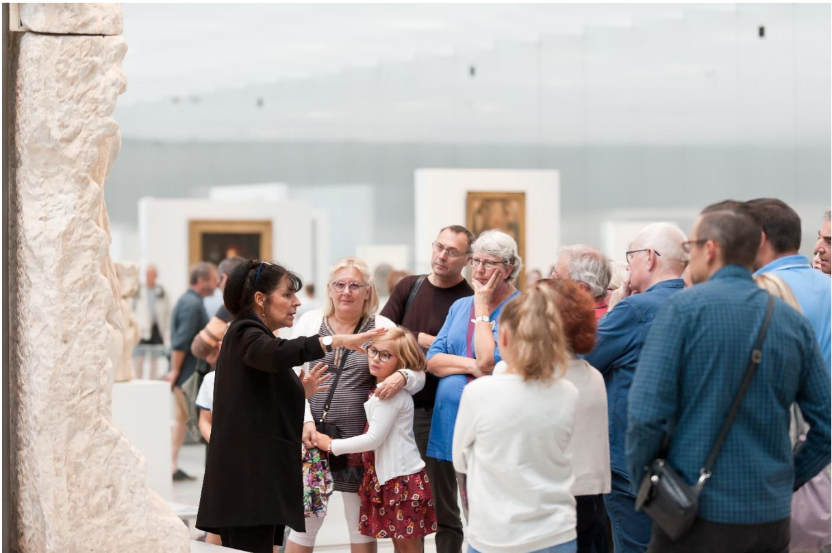
Profiter des vacances pour (re)découvrir la Galerie du temps et les expositions