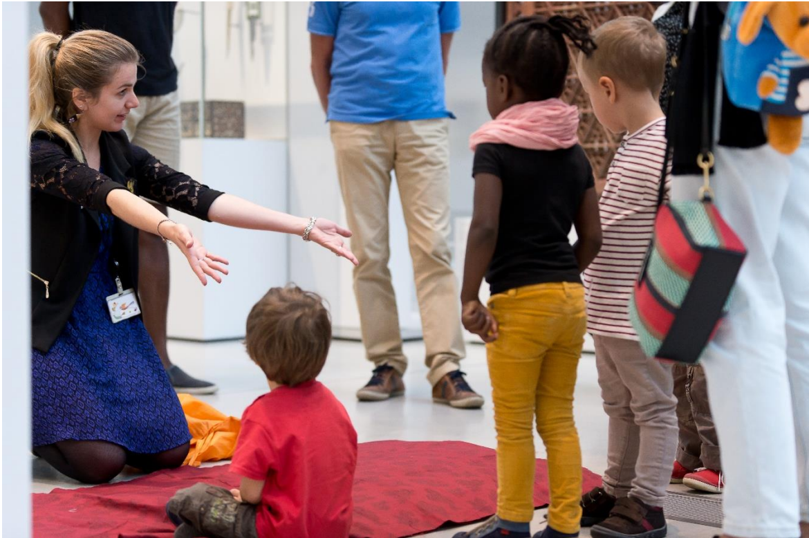
La Galerie du temps avec ses jeunes visiteurs : il n'y a pas d'âge pour s'initier à l'art !