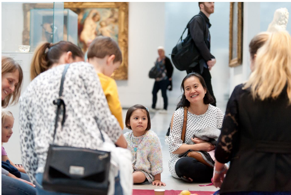
Les vacances de Noël sont l'occasion de se retrouver en famille au musée, avec des activités pour tous les goûts

Préparer des Graff de vœux, réaliser une fouille archéologique, ou jouer à l'apprenti joaillier... Parce que les vacances de Noël sont un moment propice pour se retrouver en famille, le Louvre-Lens a prévu 279 séances d'activités, dont 192 gratuites , pour permettre à tous de découvrir ou re-découvrir le musée. Ateliers créatifs, visites ludiques et insolites sont au programme, pour accueillir tous les visiteurs, des tout-petits aux plus grands, et apprendre en s'amusant. Suivez le guide !