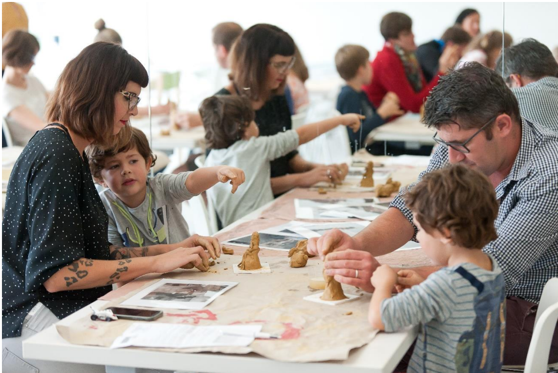
Attention, ça salit !