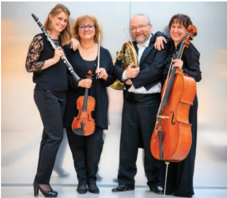
Orchestre de picardie, amtiens