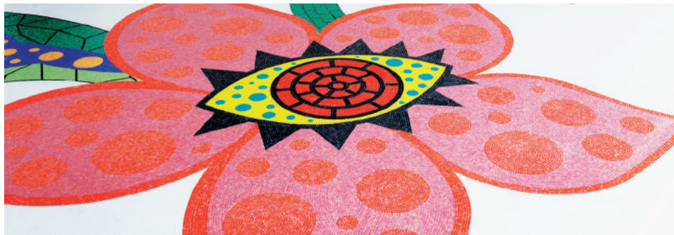
Yoko Kusama, Flowers that bloom in the universe , 2012, mosaïque. Création originale pour la Scène du Louvre-Lens, commanditaire Région Nord-Pas-de-Calais. La mosaïque a été réalisée grâce au mécénat de Trend Group