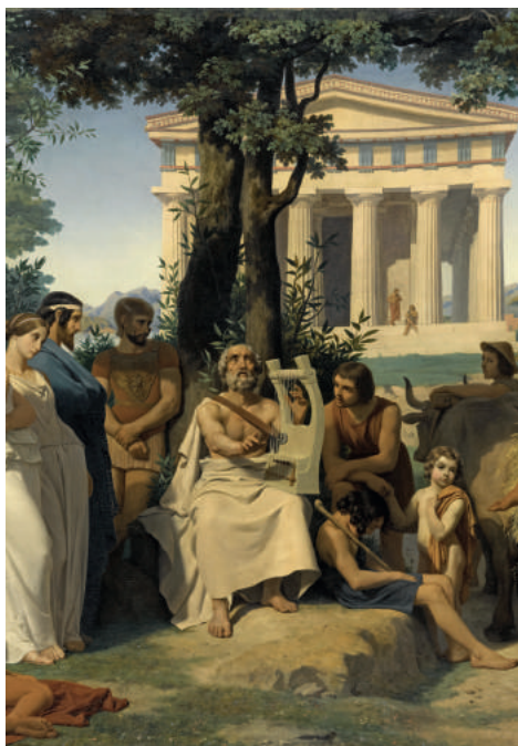
Jean-Baptiste Auguste Leloir, Homère , 1841, Musée du Louvre, département des peintures