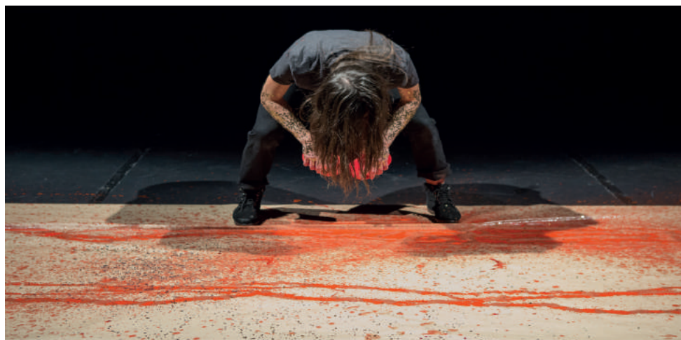
À Tire-d'aile - Iliade © Pauline Le Goff

Ulysse ne veut plus se battre... il veut rentrer chez lui. D'errance en errance, parmi les dangers d'un monde chaotique, il cherche à retrouver sa place dans le monde. Mais voilà neuf ans qu'il erre en vain sur la mer et sa terre natale se dérobe sans cesse sous les plis des eaux. Alors Ulysse s'inquiète : et si, malgré sa valeur, il n'avait pas de quoi payer le prix du retour ? Pauline Bayle centre cette fois sa recherche autour des questions de la peur et de l'identité. Ensemble, ils donnent à voir une Odyssée portée par un élan vital et investie dans le temps présent.