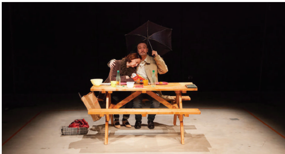
Le Dîner © Jean-Michel Guérin