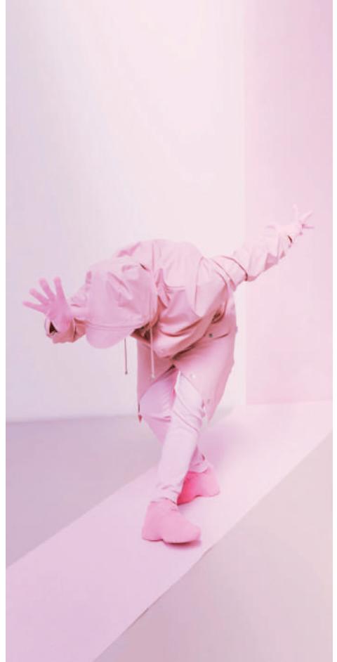
Twice © L'Anthracite