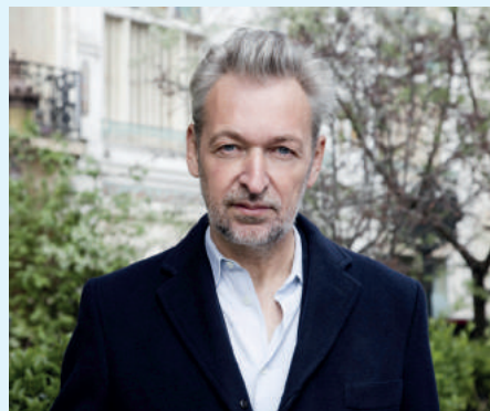
Éric Reinhardt

Rencontre exceptionnelle et dédicace d'Éric Reinhardt à 17h30 à la librairie-boutique.