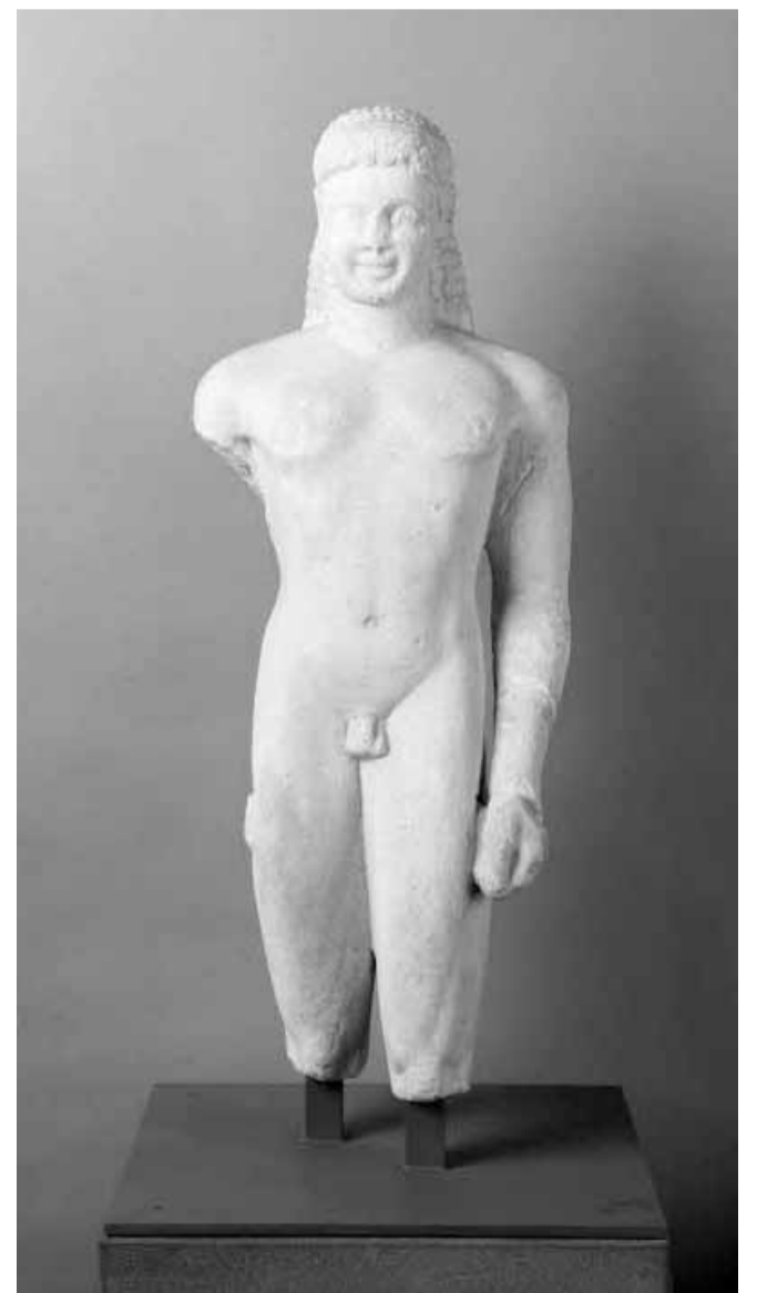
© Musée du Louvre. Couros (vers 540 avant J.C.) Marbre parien, H. : 1.03 m (inventaire Ma 3101).

L'émulation entre les sculpteurs entraîne une évolution très rapide des savoir-faire. Ainsi, en moins de cinq siècles, la maîtrise des techniques de la sculpture permet la réalisation d'œuvres aussi magistrales que La Vénus de Milo ou Le Gladiateur Borghèse (vers 100 avant J.C.).