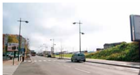
Photo de la rue Jean Létienne (décembre 2011) (État actuel de la rue Jean Létienne.)