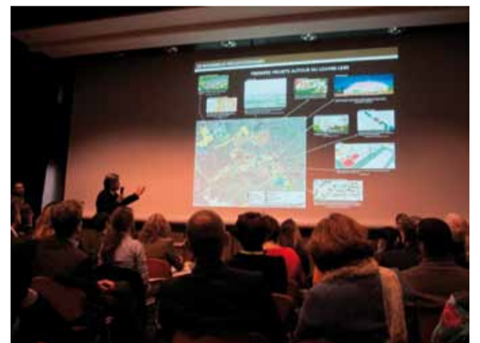
Forum des projets urbains – Paris – 8 novembre - © CR.