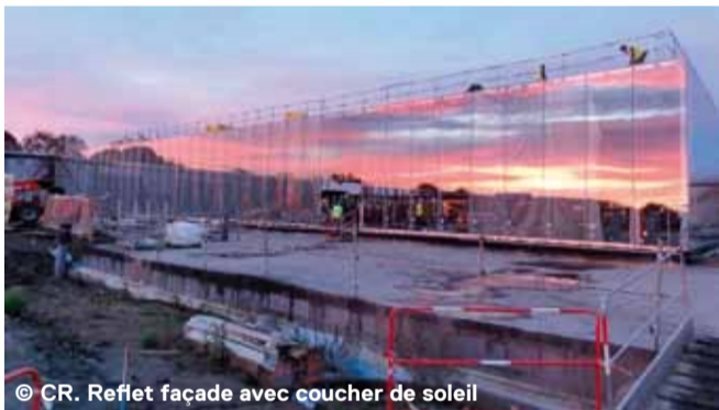
Reflet façade avec coucher de soleil

Dans les sous-sols, les locaux techniques s'équipent en appareils de production de chaleur, de traitement d'air et de matériel électrique... La finition de ces espaces est bien engagée avec la préparation des supports et la mise en œuvre de la première couche de peinture.