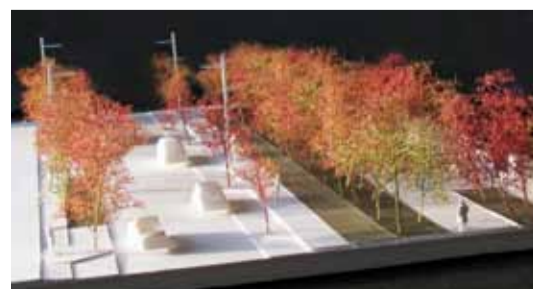
Maquettes d'études - Michel Desvigne - Paysagiste (rue Jean Létienne à fin 2012 après les plantations et l'aménagement des espaces publics)