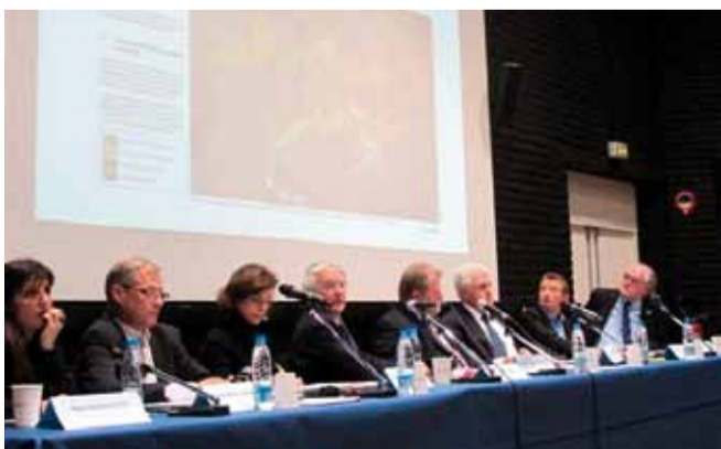
Tribune de l'Assemblée Générale Euralens – 18 novembre

L'Assemblée Générale de l'association Euralens, qui s'est tenue à la Maison du projet le vendredi 18 novembre dernier, a marqué une nouvelle étape dans la démarche engagée en faveur du développement des territoires situés autour du Louvre-Lens, en décidant la mise en œuvre du processus de « labellisation ».